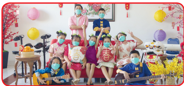
Penampilan kelompok paduan suara.