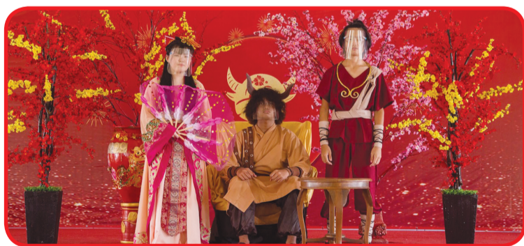
Putri Kipas Besi, Siluman Kerbau dan Anak Laki-Laki Merah.