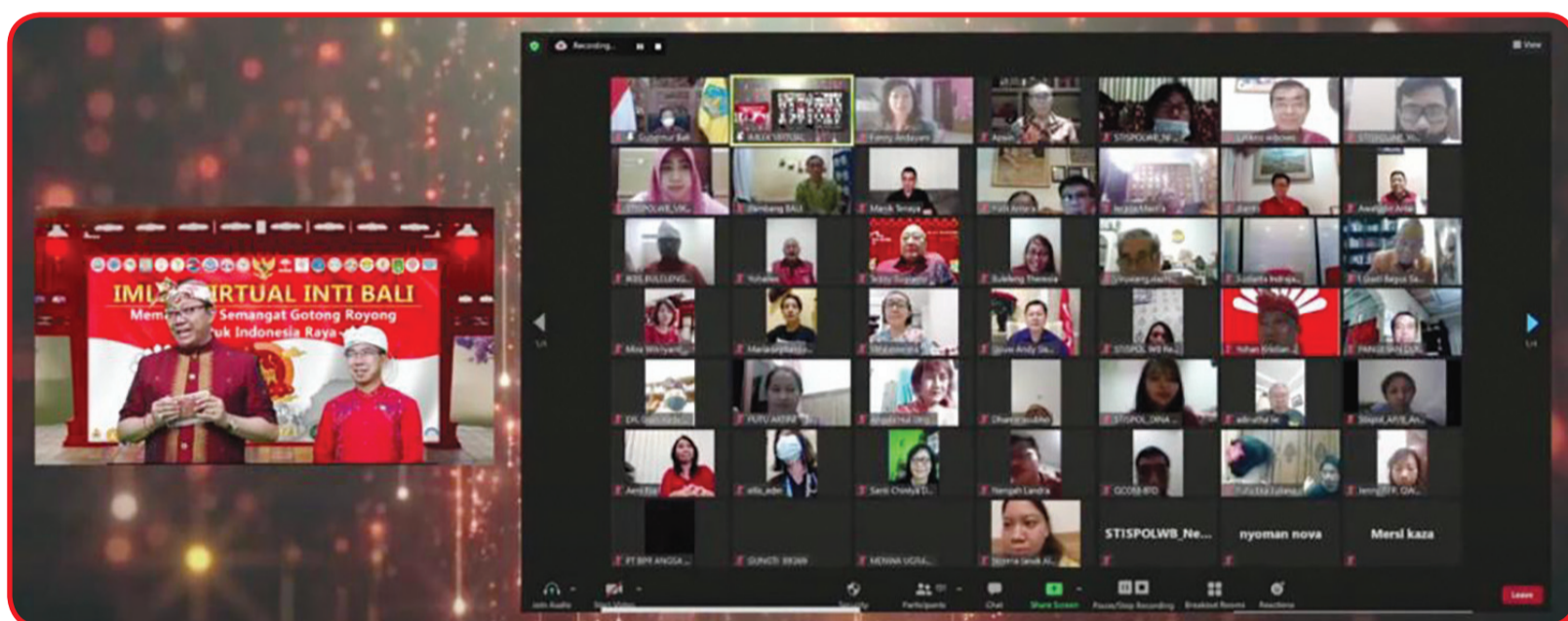
Sebagian peserta mengikuti acara lewat zoom.

INTI terus mendukung Pemerintah Daerah Bali, dan tidak berhenti melakukan kebajikan, sekaligus turut serta dalam pemulihan ekonomi," tambah Gubernur Koster.