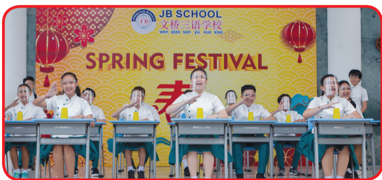
Penampilan kelompok acapella.