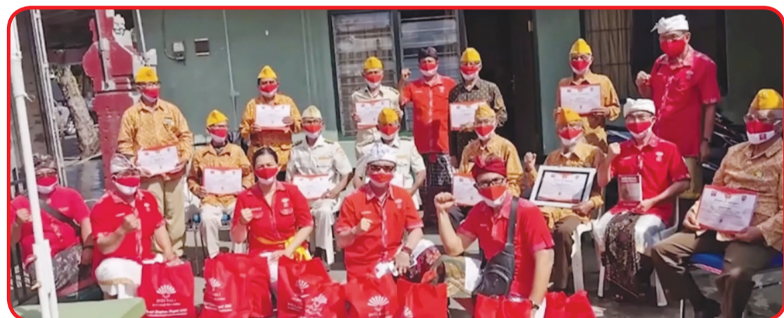
Kegiatan baksos Perhimpunan INTI Bali.