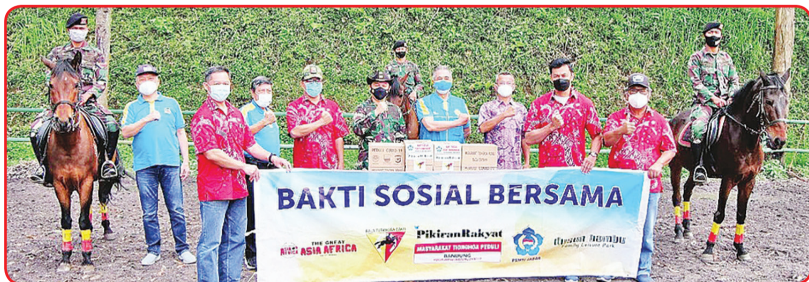
FOTO BERSAMA: Kedua belah pihak berfoto bersama sambil mengepalkan tangan merefleksikan kerjasama yang menyenangkan.