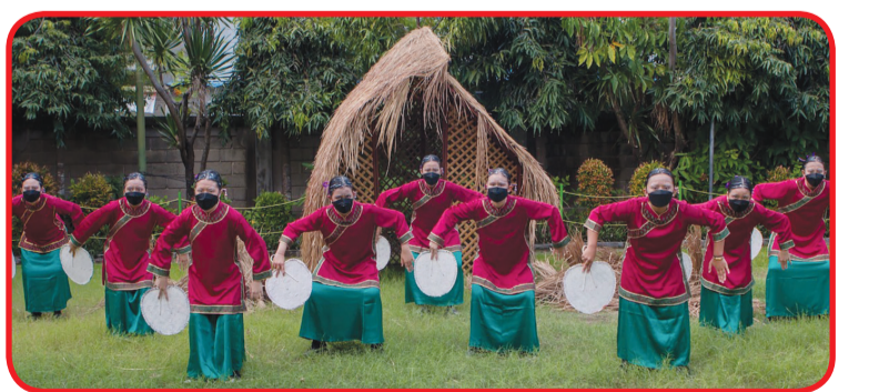
Tari "Kehidupan Bahagia Sang Nenek".

JAKARTA (IM) - Jembatan Budaya School Jumat (26/2) malam lalu menyelenggarakan kegiatan Perayaan Spring Festival secara online. Lewat persiapan selama satu bulan, guru, siswa, orangtua siswa dan masyarakat luas dapat menyaksikan kegiatan perayaan secara daring di Youtube. Perayaan tersebut mengambil tema "Legenda Siluman Kerbau". Yang diadaptasi dari mitos legenda Tionghok "Kisah Siluman Kerbau".