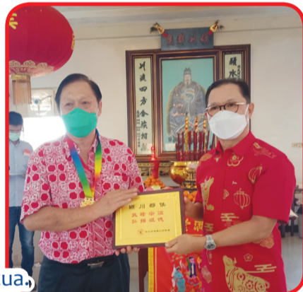
Pimpinan Yayasan Tanjung Harapan Pontianak menyerahkan piagam penghargaan kepada salah seorang tua.