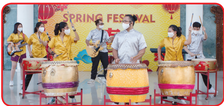
Kelompok music tabuh mini.