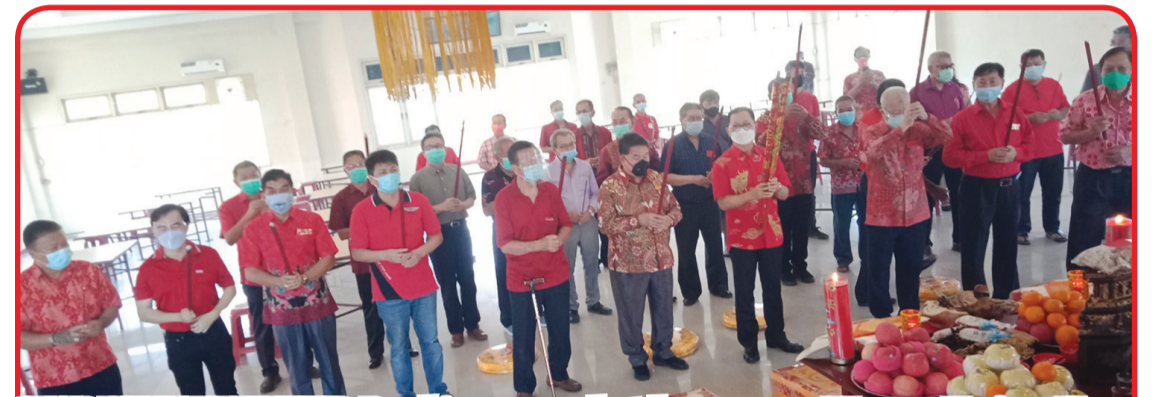
SEMBAHYANG LELUHUR: Pembina, penasehat dan pengurus Yayasan Tanjung Harapan Pontianak melakukan ritual sembahyang leluhur.